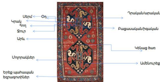
Նկ. 2. Վիշապագորգի խորհրդարանությունը ըստ Հ. Կոզիրեյոկյանի

Երկու S-աձև «վիշապների» վիշապ ամուսինների գաղափարանշանով զարդ է գտնված խեցեղենի վրա, որը հայտնի է որպես հավերժության նշան՝ իր տարբեր դրսևորումներով: Դրանց կրկնությունը ծնում է ծավալային զարդաձևեր, որոնք նույնպես գործածվում են իբրև գորգագարդ, որոնց կեռիկները երկրաչափականացված են և ունեն եռանկյան տեսք, հետևաբար նման զարդերը կարող են անվանվել նաև «դիցաբանական» զարդեր: Մեծ տեղ է հատկացվել առասպելներին, որոնց բառային արժեքը կարելի է գտնել Ք. ա. 3-2-րդ հազարամյակից մեզ հասած խեցեղենի վրա պատկերված զարդերի ու կարգավորված գաղափարների հիման վրա: Միջնադարյան հայկական հին գորգերից է վիշապի դեմ փյունիկի պայքարը բովանդակող կենդանապատկեր գորգը: