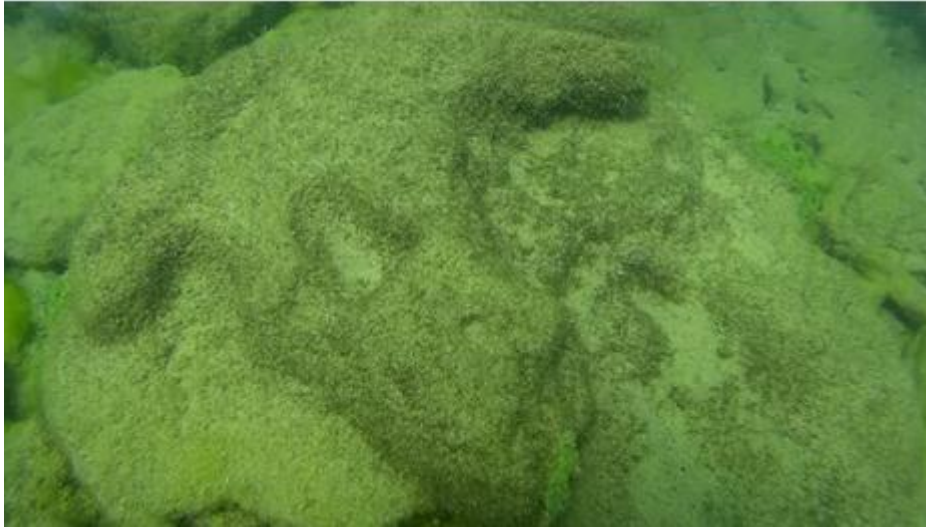
Նկ. 3. Նույն հատվածում խոյի գլուխ հիշեցնող քանդակ:

Սևանա լճի հատակում՝ Արտանիշի հրվանդանից դեպի արևմուտք՝ 7-15 մետր խորությամբ՝ մոտ 500 մ 2 տարածքում, հայտնաբերվել է մի ուշագրավ տեղամաս, ինչը հնագույն բնակատեղի էր հիշեցնում (Նկ. 2, 3, 4):