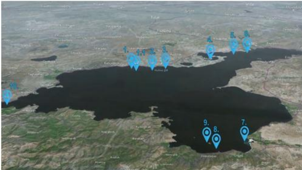
Նկ.1. Վանա լճում ջրասույզ հուշարձանների քարտեզը: