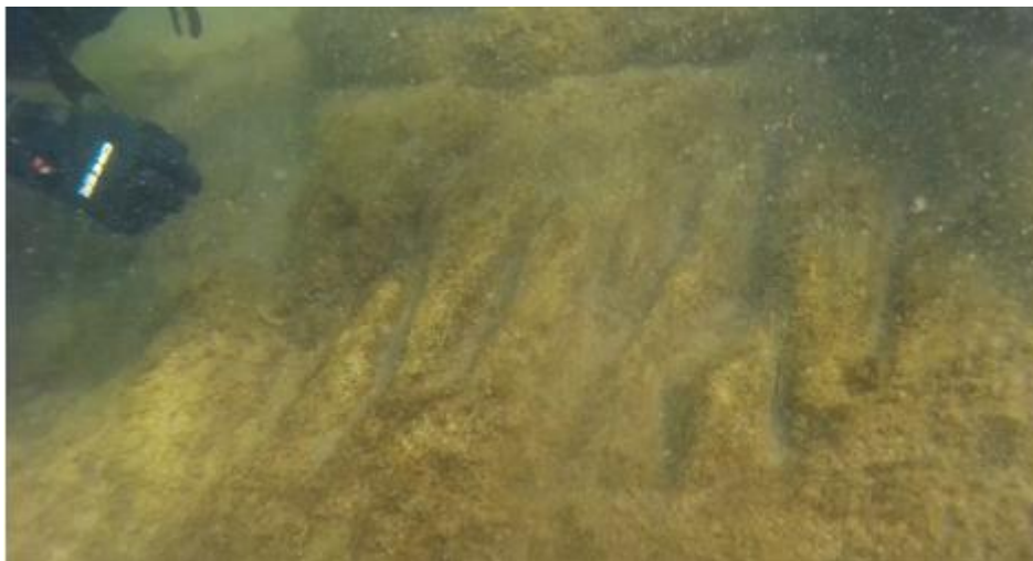
Նկ. 4. Նույն հատվածում սեպաձև երկայնակի կտրվածքներով քանդակ:

Տարածքը մասնագիտական ուսումնասիրման կարիք ունի: (Որպեսզի նկարները տեղ չզբաղեցնեն, տեղադրում ենք տեսագրված նյութի հղումը) [23]: